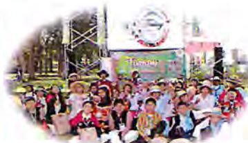
SEGUNDA ETAPA DURANTE EL TINKUY IV Encuentro de estudiantes