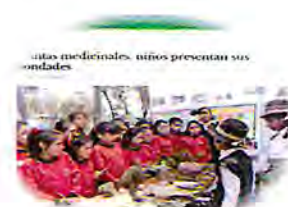
TERCERA ETAPA DESPUÉS DEL TINKUY Comunicar