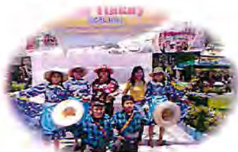
PRIMERA ETAPA ANTES DEL TINKUY Pre Tinkuy

El Tinkuy regional está constituido por 3 etapas en su proceso de implementación, cada una es complementaria de la siguiente.