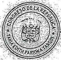
TANIA EDITH PARIONA TARQUI Congresista de la República